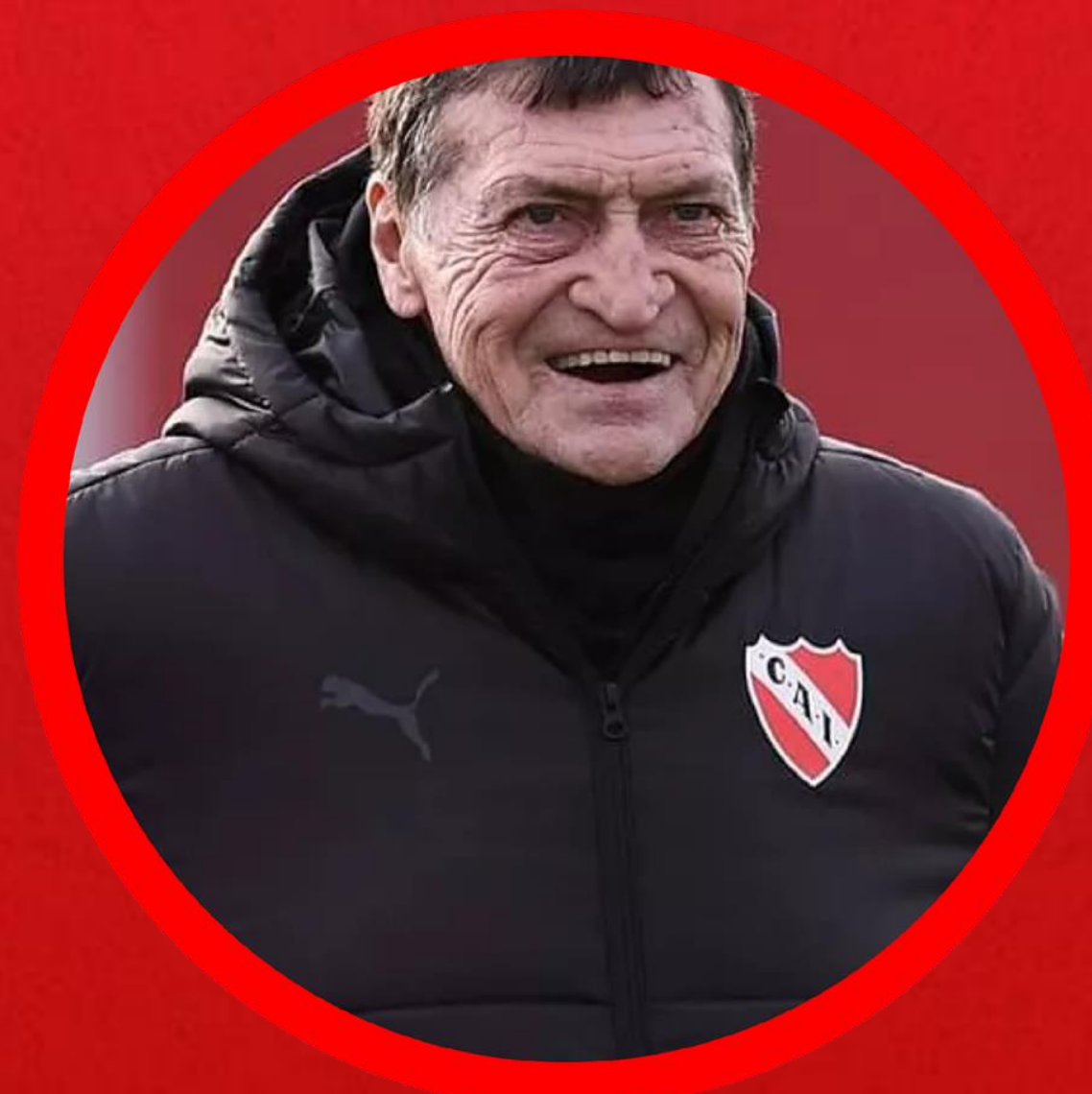
JULIO CÉSAR FALCIONI (2021)