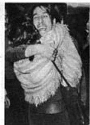
Rawson, Devoto, Córdoba, Resistencia, Chaco, Salta, Ezeiza, expresan la alegría de un pueblo que supo arrancar a la dictadura la libertad de sus presos.